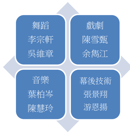
圖 5-2 配合發展四大領域之專業教師分組