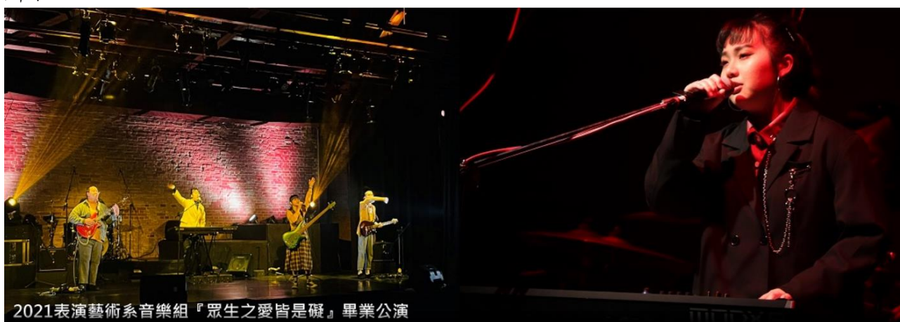
圖 1-2 本系空港樂團於西門紅樓舉辦全原創音樂會

本系於 109 學年整合音樂基礎、節奏基礎、歌唱技巧、樂團排練、DJ 課程與數位音樂與音效相關必修課程，培養學生從基礎的樂理知識逐步擴展到詞曲創作，配樂創作與編曲、演奏演唱、錄音混音、到獨立製作 EP。近年學生除了在各項歌唱競賽獲獎外，並已有學生作品擁有百萬點閱，以及商業接案，今年 4 月系樂團也以全原創音樂會於西門紅樓演出，如圖 1-2 所示。