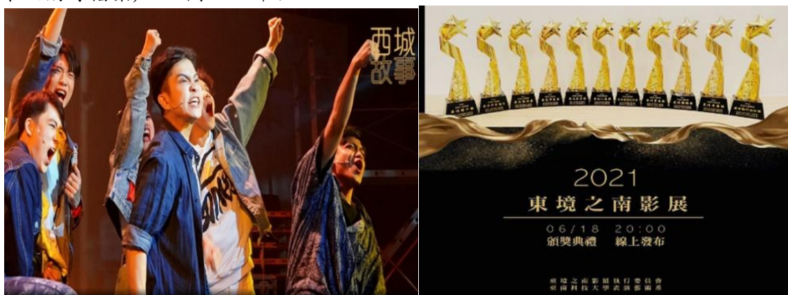
圖 1-1 109 學年度演出實務作品「西城故事」與「東境之南影展」

有鑑於現今跨領域藝術的興起已蔚為潮流，系上專任師資也皆為跨界藝術領域之卓越藝術家，深知跨界能力於表演藝術產業的重要性，為了培育下一代的人才本系於 109 學年度整合一至三年級演出實務課程，每學期以戲劇、影視、舞蹈、音樂等不同的屬性的主題推出共同製作配合新媒體與科技藝術的運用，培育每個學生除了本身的專業外，也同時能在六個學期中與不同藝術領域的藝術專業合作，打破既有的框架，進而帶動思維與表演模式的碰撞與媒合。109 學年度共推出戲劇作品「西城故事」與「東境之南影展」19 部影視作品(請參閱現場紙本及附錄檔案)，如圖 1-1 所示。