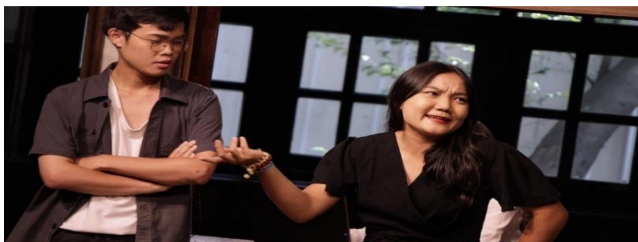
圖 1-3 109 學年度學生參加 2020 年台北藝穗節《離婚大時代》戲劇展演。